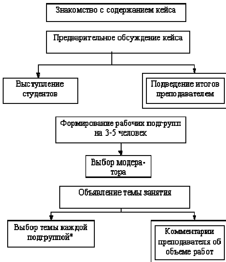
Стадия организации работы над кейсом

Последовательность организации и проведения занятий представлена на рисунках.